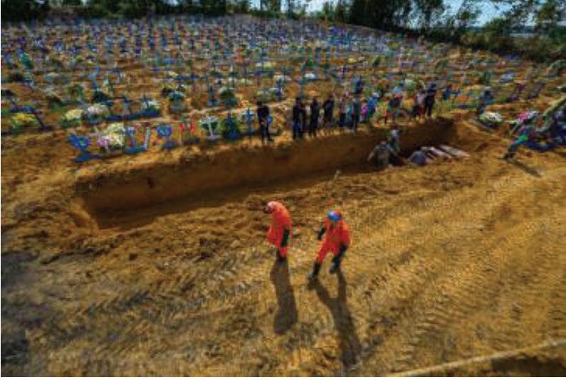
مقبرة جماعية لضحايا الوباء في البرازيل