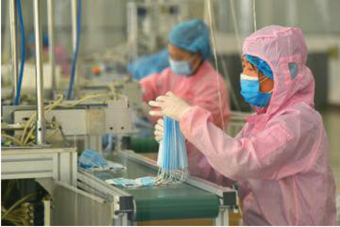
تخصيص مصانع ضخمة في الصين لإنتاج الكمادات