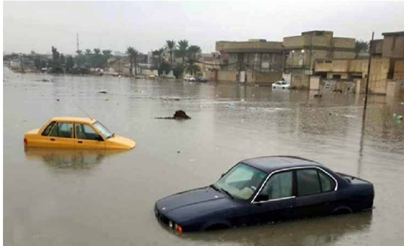
هكذا تخدم الامانة والبلديات المواطنين العراقيين في تصريف مياه الامطار!