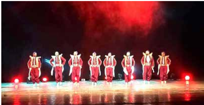
بغداد- طريق الشعب

استأنفت دائرة السينما والمسرح فعاليات أيام الفن العراقي، حيث نظمت فعالية "ليالي السليمانية" خلال يومي الخميس والجمعة الماضيين.