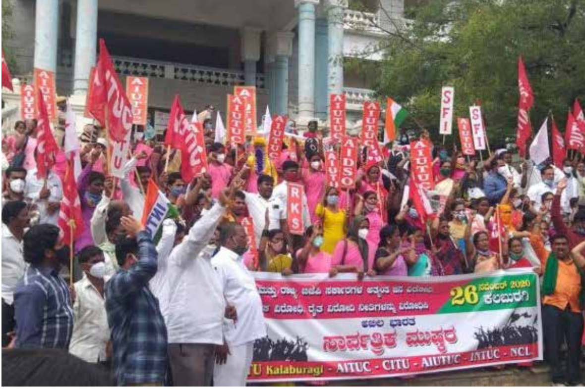
جانب من الإضراب غير المسبوق

والإضرابات العمالية بهذا الحجم واسعة المشاركة ليست جديدة على الهند، التي يبلغ عدد سكانها 1,4 مليار نسمة، حيث شارك قرابة 200 مليون عامل في إضراب تاريخي بداية عام 2019، وقرابة 150 مليون عامل في إضراب 2016، وقرابة 100 مليون في إضراب عام 2012 متجاوزين كافة الانقذامات العرقية والدينية.