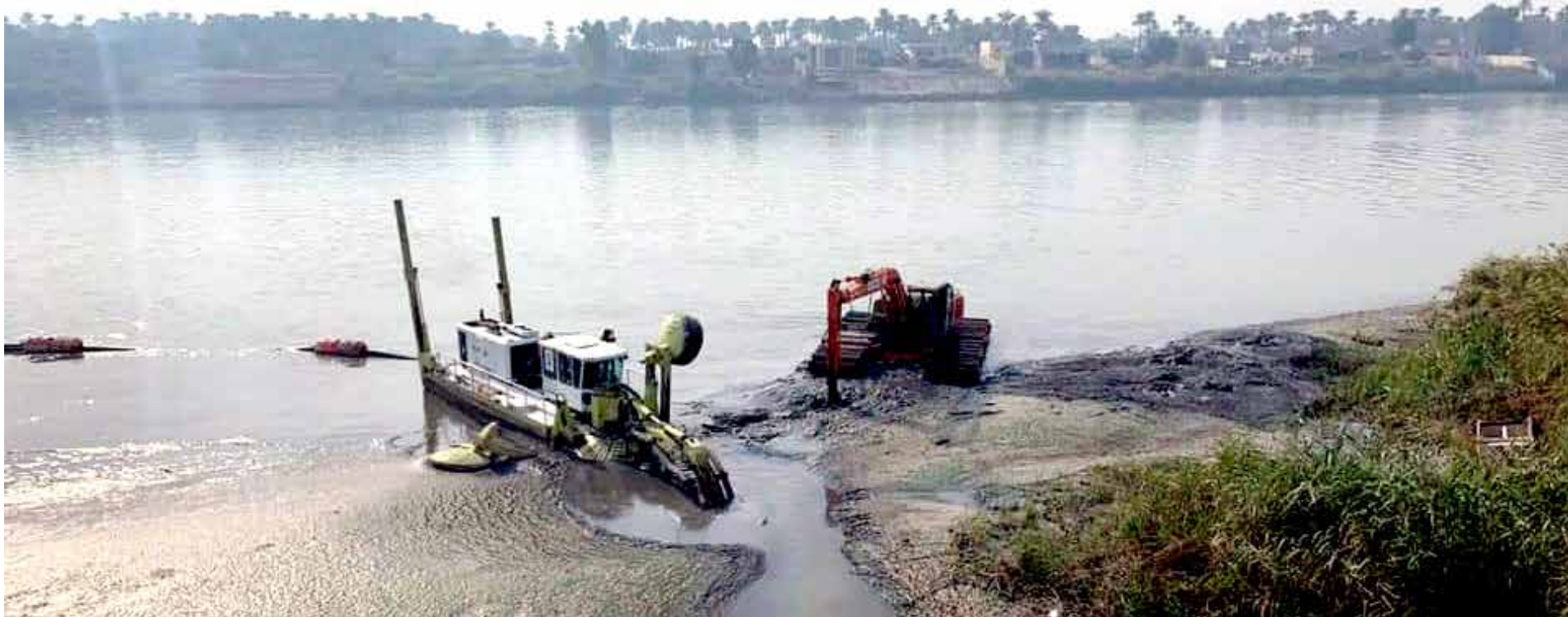
من هنا تسحب امانة بغداد الماء لشبكة الاسالة

تتهم دوائر حكومية تابعة لأمانة بغداد، وزارة الموارد المائية، بافتعال مشكلة "الرائحة الكريهة" في ماء الاسالة، التي يشكو منها مواطنو مناطق جنوب شرق العاصمة، منذ خمسة أيام، لكن الوزارة ترد على تلك الاتهامات بـ"تجاهل" دعواتها السنوية للأمانة بتنظيف مضخات المياه، في نهر دجلة.