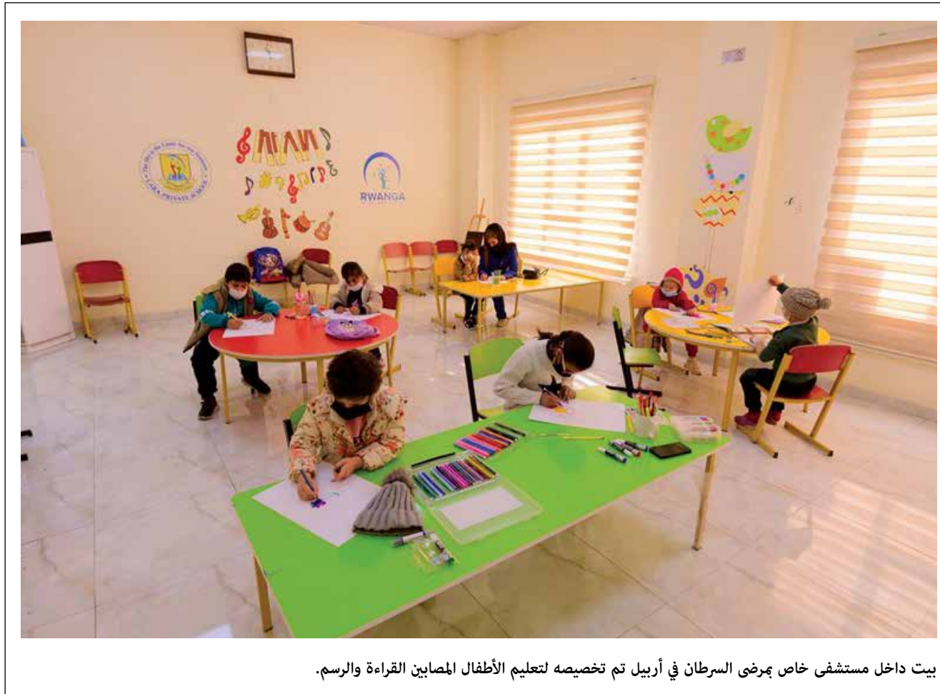
بيت داخل مستشفى خاص مريض السرطان في أربيل تم تخصيصه لتعليم الأطفال المصابين بالقراءة والرسم.

من توافد اعداد كبيرة على المسيرة، مطالبين شركة نفط البصرة بتوفير فرص عمل لهم في الحقول النفطية والشركات التابعة لها.