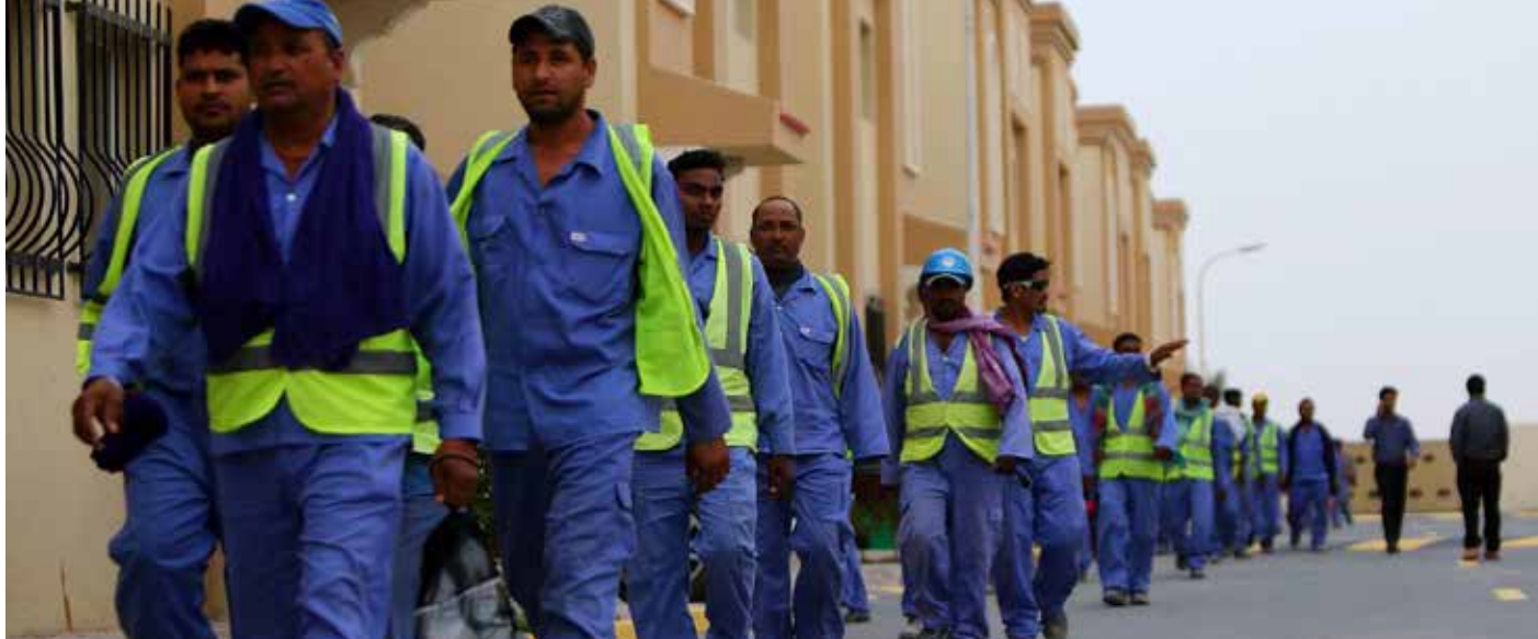
العمالة الاجنبية تغذي جيش العاطلين من العراقيين

يواجه ملف العمالة الاجنبية في العراق، مشكلات كثيرة تتعلق بصلاحيات الوزارات وأعمالها، ومزاجية أصحاب الشركات والمشاريع، وفي العمال أنفسهم، الذين يتحول بعضهم الى مصدر تهديد للمجتمع، تحت «غياب الرقابة الحكومية».