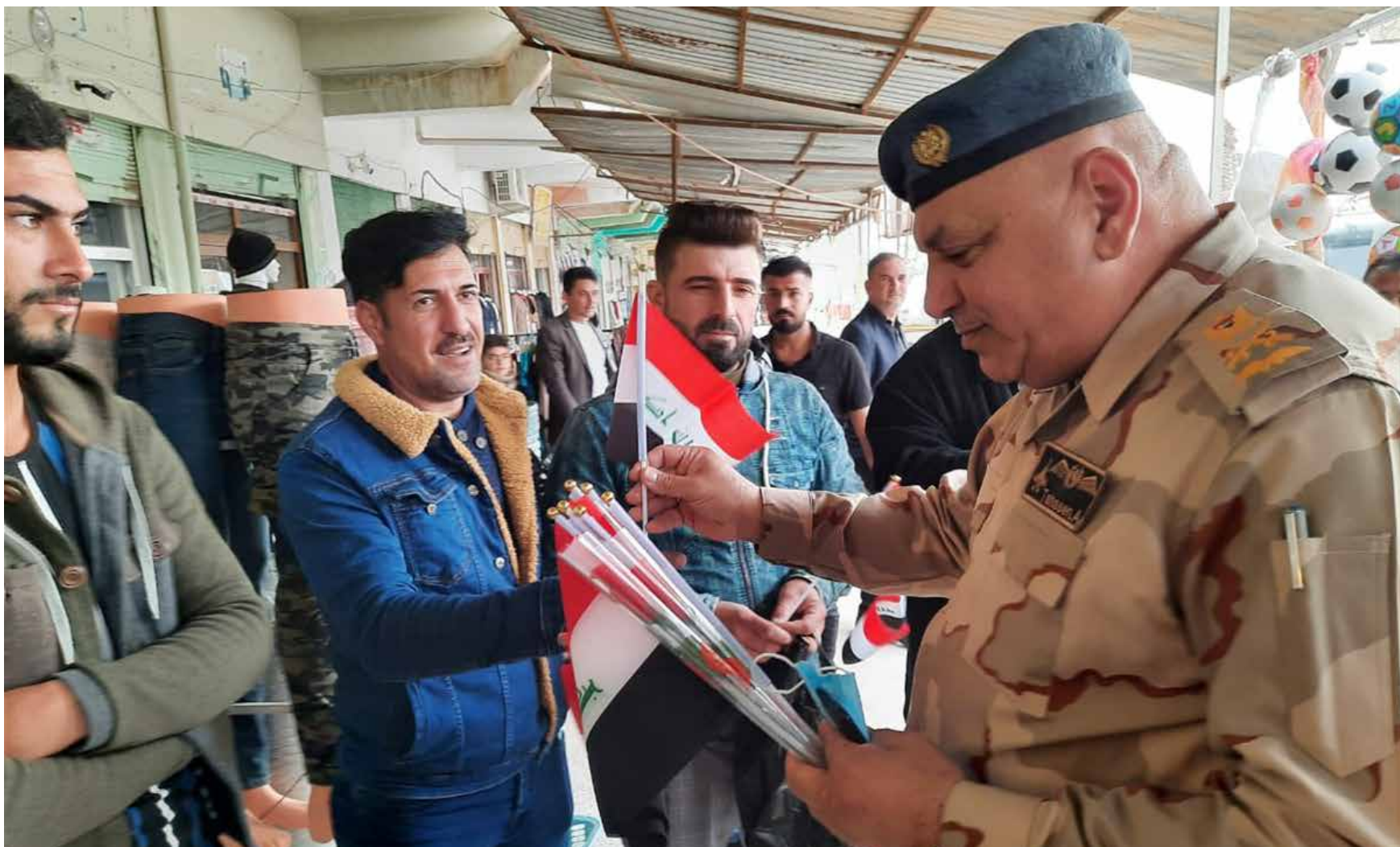
المحدث باسم قيادة العمليات المشتركة اللواء تحسين الخفاجي يوزع الاعلام العراقية على المواطنين في أسواق سنجار، يوم الثلاثاء.

وهناك من يربط اسم مدينة سنجار بقصة الطوفان؛ حيث أن سفينة نوح لما مرّت بالجبل نطحت به، فقال «هذا سن جبل جار علينا» فسميت (سن- جار). ويقال: أن السلطان سنجرين ملك شاه بن ألب، أرسل ولده ليكون ملكاً عليها بعد سلطان خراسان. ويعود تاريخ سنجار إلى الألف الثالث ق.م. وزنج تعني أسود أو المصدي نسبة إلى قمة الجبل، وهذا تفسير آخر لمعنى الاسم. وقد سميت