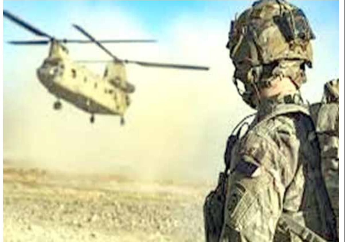
أفغانستان والأمن المفقود

متابعة - طريق الشعب قدم قائد قوات الدفاع الأسترالية، أنجوس كامبل اعتذاراً مباشراً للشعبين الأفغاني والأسترالي، عن جرائم تورطت فيها القوات الخاصة الأسترالية في أفغانستان. وكان تقرير قد صدر عن المفتش العام لقوات الدفاع الأسترالية بعد تحقيق استمر أربع سنوات بشأن سلوك القوات الأسترالية الخاصة في أفغانستان بين عامي 2005 و2016. وأفاد التقرير بوقوع 39 جريمة قتل غير قانونية لأشخاص على أيدي أفراد القوات الخاصة الأسترالية أو تورطهم فيها. وأن عمليات القتل لم تحدث خلال المعارك. وأكد المفتش العام: "القتل (بشكل عام) والقتل غير القانوني للمدنيين والسجناء أمر غير مقبول على الإطلاق، ومن واجبي وواجب زملائي أن أعيد الأمور إلى نصابها الصحيح"، و"أعذر بصدق ودون تحفظ لشعب أفغانستان عن أي مخالفات ارتكبتها الجنود الأستراليون". ووصف القاضي الأسترالي بول بريريتون المعلومات الواردة في التقرير، أن هذه الواقعة "أكثر الأحداث المخزية في تاريخ أستراليا العسكري". من جانبه، أعلن رئيس الوزراء الأسترالي سكوت موريسون أنه سيتم إنشاء مكتب محقق خاص لتحديد ما إذا كان سيتم مقاضاة "السلوك المزعج" الوارد في تقرير. ويأتي إعلان رئيس الوزراء ليمثل هرباً إلى الأمام بعد ان حاولت الحكومات الأسترالية المتعاقبة تعميم ومحاصرة التقارير التي تناولت جرائم الحرب. في العام 2017 تعرض العاملون في محطة اي بي سي الأسترالية إلى تحقيقات أمنية بعد نشر تحقيقهم الاستقصائي في جرائم الحرب المزعومة، والمعروف باسم "ملفات أفغانستان" ان المبلغين عن فظائع مثل قتل الأطفال أو إطلاق النار على السجناء والمدنيين كانوا رفاقاً للجنة المحتملين. ولا شك أن مثل هذه الأعمال التي يقوم بها منتسبون لجيش بلد يحلو له أن يصف نفسه بالديمقراطي