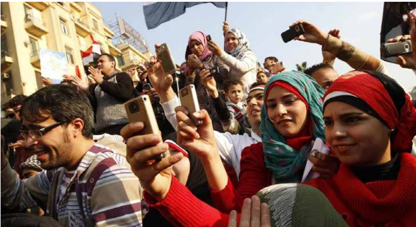
ناشطون يوثقون بهواتفهم الاحتجاجات في ساحة التحرير بالقاهرة - 2011

قبل عقد من الزمن، منحت مواقع التواصل الاجتماعي والهواتف الذكية المتظاهرين الشباب خلال الربيع العربي وسيلة تقنية ساعدتهم على الإطاحة بأنظمة متسلطة ومتجذرة، بعد أن انتشرت بواسطتها روح الثورة.