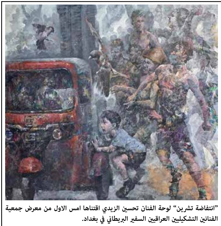
"انفجاسة تشرين" لوحة الفنان تحسين الزبيدي اقتناها امس الاول من معرض جمعية الفنانين التشكيليين العراقيين السفير البريطاني في بغداد.

وفي سياق الندوة، جرت نقاشات بين ناشطات في الرابطة وجمع من بنات القرية، حول القوانين التي تحمي حقوق المرأة، وقانون مناهضة العنف الأسري الذي لا يزال مركباً في أدرج مجلس النواب من دون تشريع.