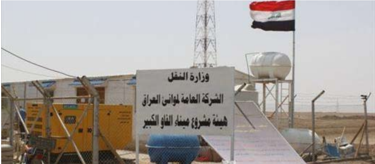
خمس شركات عالمية بدأت بتقديم عروضها للاستثمار في ميناء الفاو

القانون"، متوقعة ان "يكون حسم القانون خلال العام الحالي . وأشارت الى أن "إطلاق التعديل الثالث لقانون الاستثمار من الممكن ان يحدث طفرة نوعية في مجال الاستثمار، بسبب ان العراق يمتلك البنى التحتية للعمل ووفق الأجنية لا تزال مترددة بسبب تخوفها من الواقع الأمني غير المستقر في العراق.