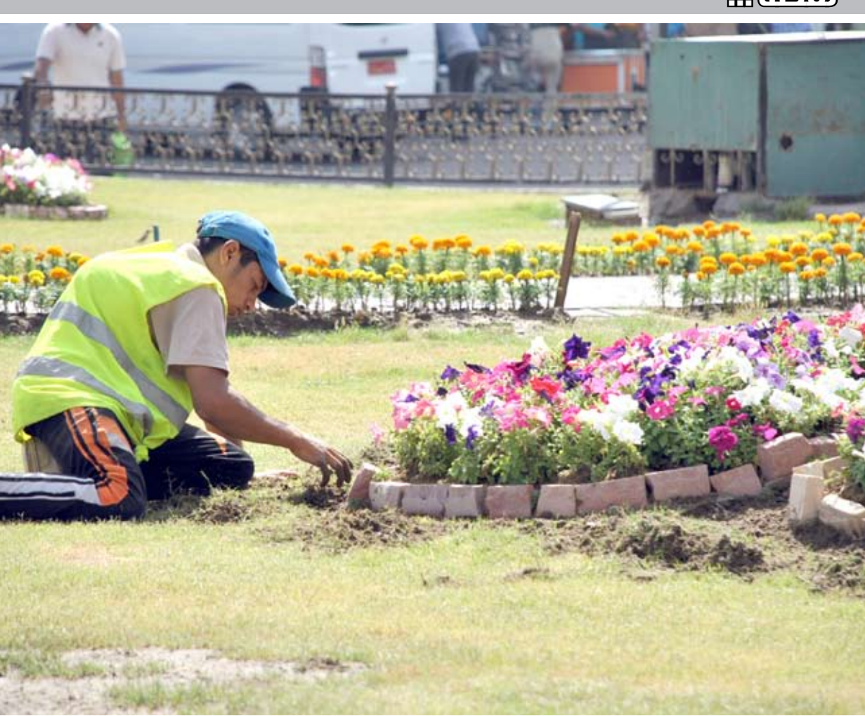
ازرعوا الورد في كل مكان، فهو يسر العيون ويريح النفوس